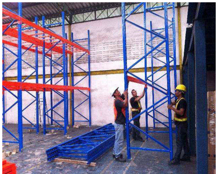
Pallet Racking - Installation