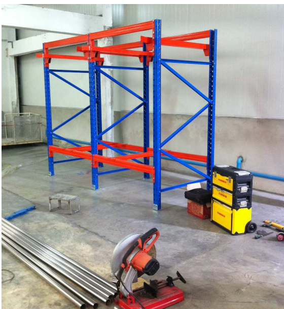
Debagging Racking - installation

โครงสร้างจะเป็นเหล็กแผ่นพับ เพิ่มความแข็งแรงของโครงสร้างด้วยการออกแบบพับเหล็กที่ดี จึงได้น้ำหนักโครงสร้างที่เบาแต่รับน้ำหนักได้มาก ส่วนมากจะใช้แผ่นเหล็กเกรดต่างๆ เช่น SS400, SS401 และ JIS G3103 เป็นต้น การยึดโครงสร้างด้วยข้อเกี่ยวเคียวเหล็ก 3 ชั้นต่อจุดและยึดแน่นด้วยน็อตและแหวน ฐานใช้เหล็กพับและชั้นยึดซึ่งแยกจากโครงสร้างสามารถถอดเปลี่ยนได้ โครงสร้างจะทรงตัวด้วยคานรับน้ำหนักเป็นระบบ และเพิ่มความสวยงามด้วยการพ่นสีฝุ่น สีส้มสำหรับคานหลักและสีฟ้าเข้มสำหรับคานรอง และการออกแบบโครงสร้างจะได้ค่าความปลอดภัยน้ำหนักใช้งานที่ 1.1:65 อีกทั้งยังมีเหล็กกันข้างแยกอิสระกับชั้นวางเพื่อป้องกันการชนชั้นวางโดยตรง การใช้งานเหมาะสำหรับสินค้าบนพาเลท เช่น แม่พิมพ์ กล่องบรรจุสินค้า ถุงเม็ดพลาสติก และสินค้าอื่นๆ เพื่อประหยัดพื้นที่จัดเก็บ